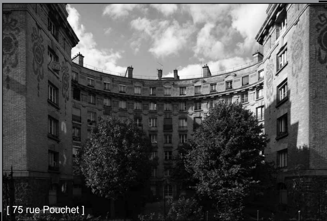
[ 75 rue Pouchet ]

Au 75 de la rue Pouchet, au coin de la rue Ernest-Roche, un immeuble de briques majestueux, de forme semi-circulaire, précieusement décoré d'un pavage de briques bleu-vert émaillées, aux motifs délicats. Ce sont les actionnaires de la Société des Batignolles, encore influencée par les idées saint-simoniennes établissant un lien étroit entre progrès technique, progrès économique et progrès social qui firent bâtir cet immeuble, en 1907, pour les employés et les ouvriers.