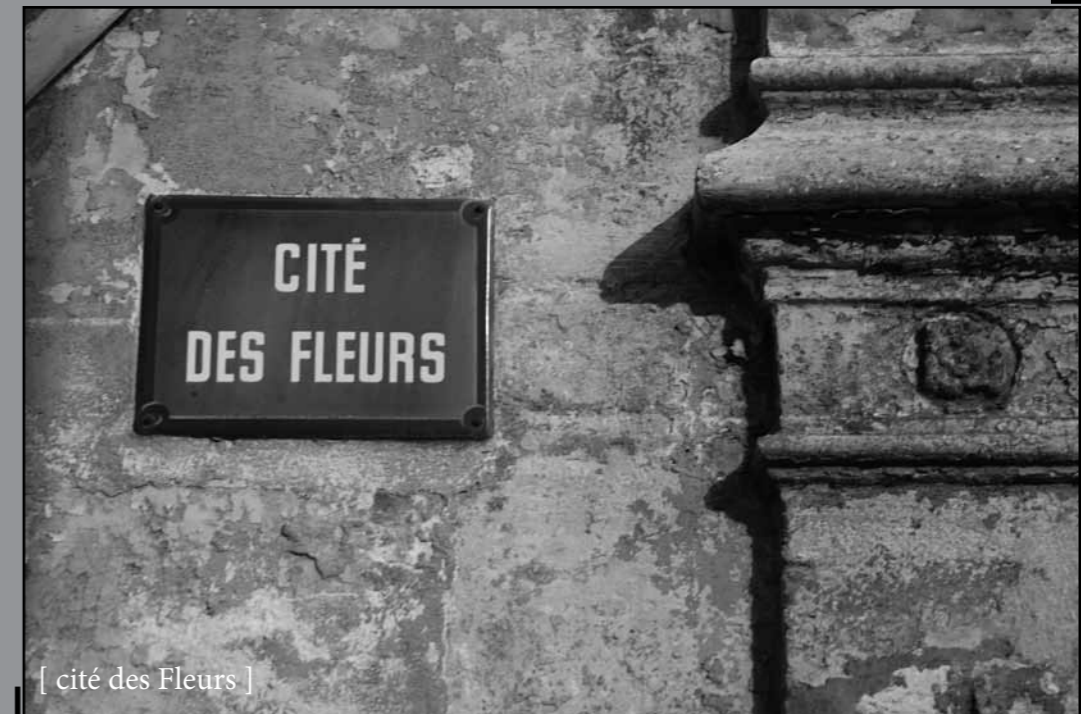
[ cité des Fleurs ]