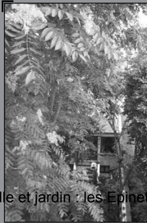
[ 40 rue Lacroix ]

Le milieu de la rue des Apennins est bordé d'immeubles de petite hauteur: les terrains étaient fragiles à cause des carrières, la pression démographique n'était pas encore très forte. Alors se côtoyaient ateliers et petits hôtels particuliers. Au 21 de cette rue, de 1874 à 1877, Zola trouva la tranquillité nécessaire à son travail d'écrivain. Derrière les façades de la rue des Apennins et de la rue Lacroix s'est formé un vaste rectangle de jardins soigneusement arrangés, paradis des chats, on y aura vu des tortues libres... qui disparaissent sous les feuillages de vieux marronniers et d'acacias. Ainsi ce quartier, marqué par l'essor de l'industrie et de l'artisanat, qui se peuple tout au long du 19ème siècle, porte encore les traces de son passé de faubourg campagnard.