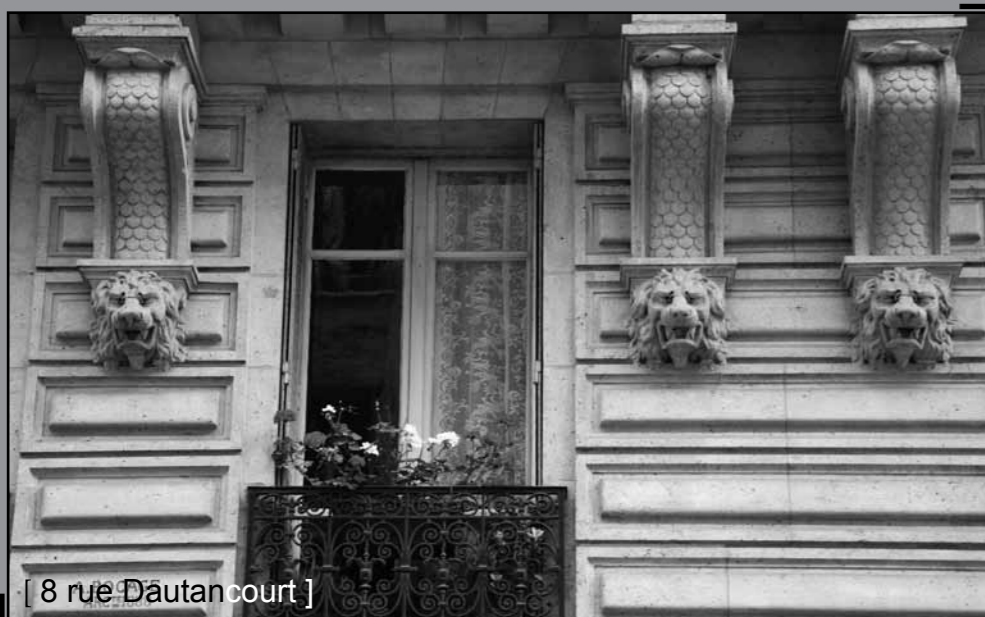
[ 8 rue Dautancourt ]