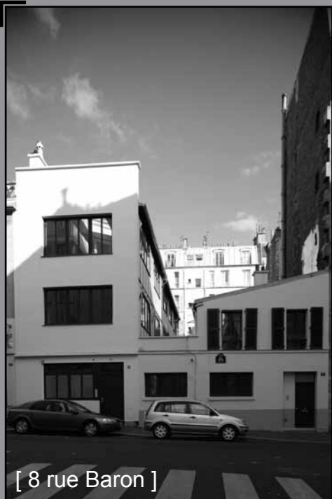
[ 8 rue Baron ]