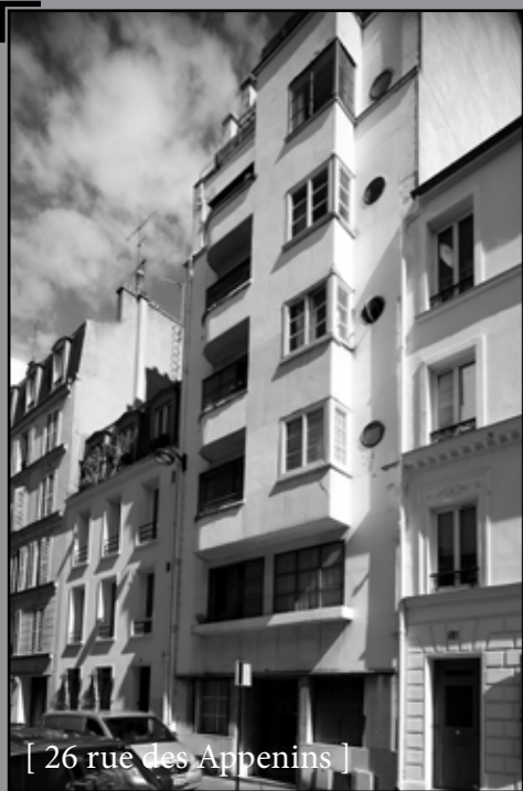
[ 26 rue des Apennins ]