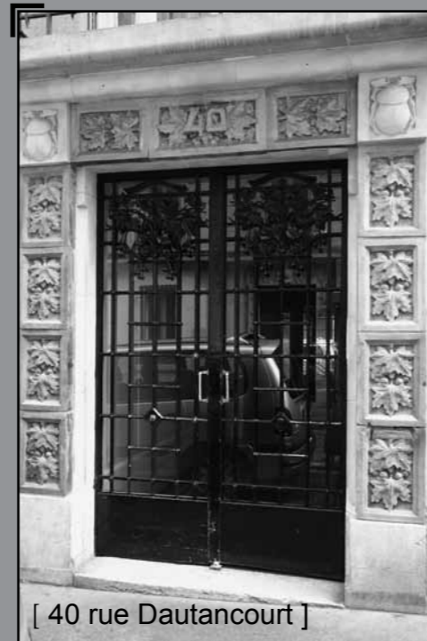
[ 40 rue Dautancourt ]

Au début du siècle, le décorateur efface le travail de l'architecte. La porte en fer, début 20 ème , remplace les portes en bois, l'élément essentiel de la façade est décorée d'émaux élégants et le mélange du verre et du fer est un jeu subtil sur les transparences.