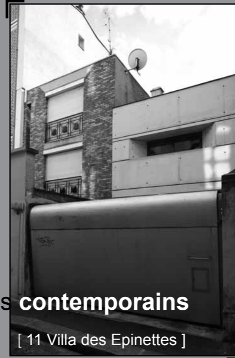
[ 11 Villa des Epinettes ]