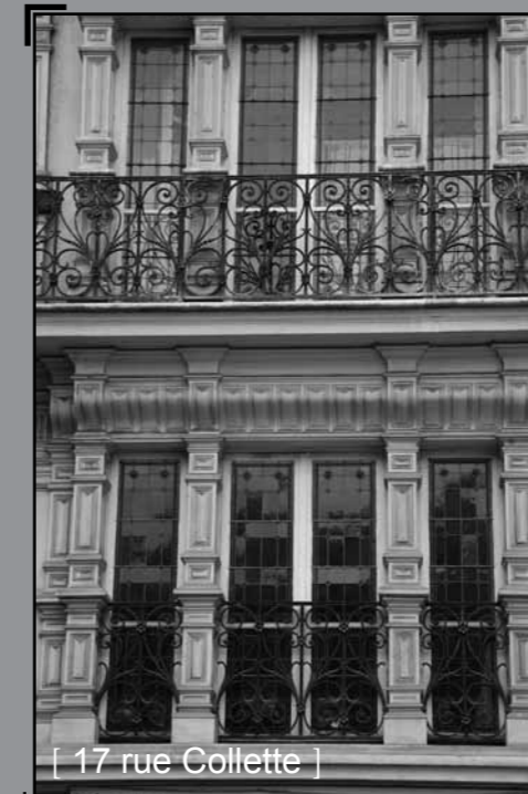
[ 17 rue Collette ]

En 1882, le règlement de la ville de Paris autorise les bow window. Pièce lumineuse dédiée à la réception, même dans les immeubles petits bourgeois