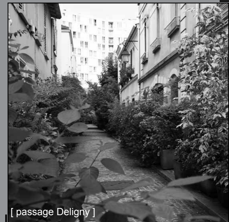
[ passage Deligny ]

Quant aux allées de petites maisons ouvrières, telles le passage Deligny, où devaient loger les employés des chemins de fer, des parisiens amateurs de calme, d'harmonie des formes et des couleurs en ont fait un jardin secret dans Paris.