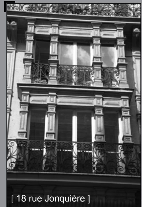
[ 18 rue Jonquière ]

Ce sont surtout les fenêtres qui sont l'objet de l'attention des décorateurs et artistes plasticiens. Ces immeubles aux appartements de conception moderne attirent alors une moyenne bourgeoisie