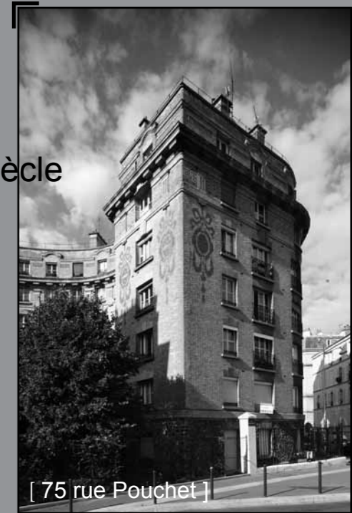
[ 75 rue Pouchet ]

Cet immeuble est conçu comme le fond d'un décor admirable d'une pièce où se joue l'avenir des hommes du 20ème siècle.