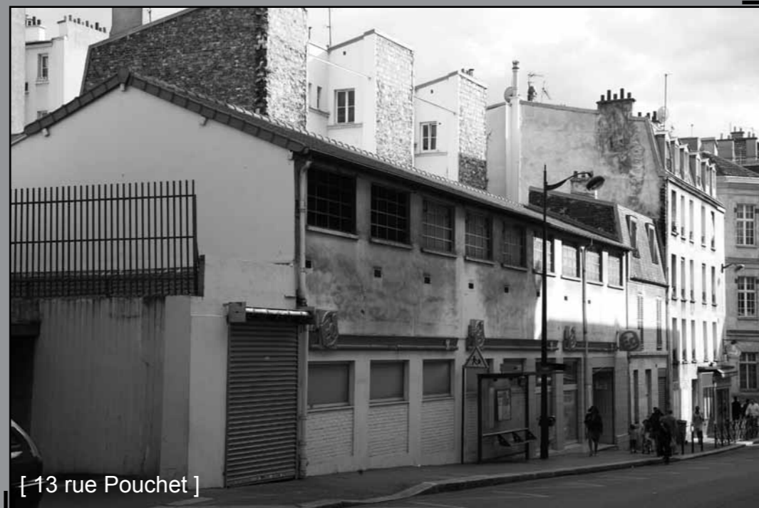
[ 13 rue Pouchet ]

Les Epinettes ne sont plus le quartier ouvrier parisien par excellence. Les activités de l'artisanat et de l'industrie ont disparu. Et puis la spéculation foncière a fait son œuvre : le terrain et le bâti valent cher. Les ouvriers ont été repoussés au delà du périphérique. Le quartier des Epinettes se transforme.