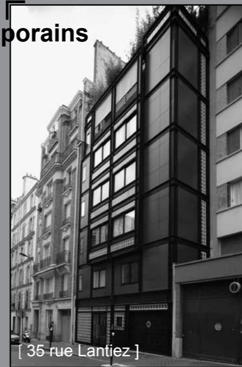
[ 35 rue Lantiez ]

Au 35 de la rue Lantiez (1996), les architectes (F. Lérault, PH. Berthomier, X. Fredet, B. Toktay) ont le même souci de la recherche d'un équilibre classique, du jeu des lumières. Mais plus de béton blanc sinon de la couleur, du métal, du verre qui se combinent pour jouer des brillances et des transparences.