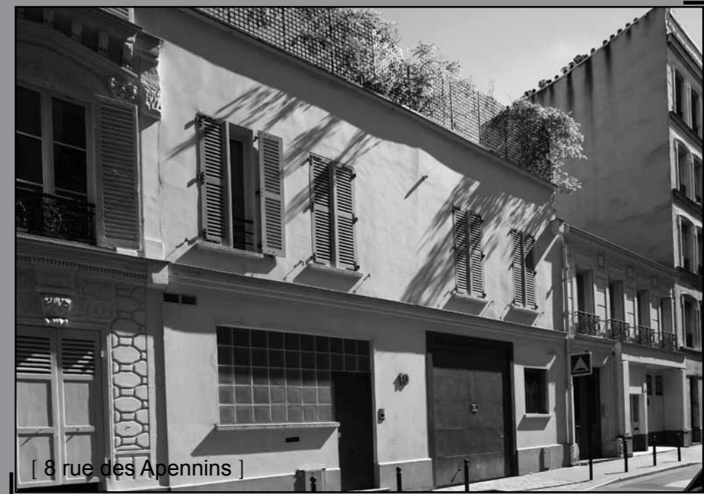
[ 8 rue des Apennins ]