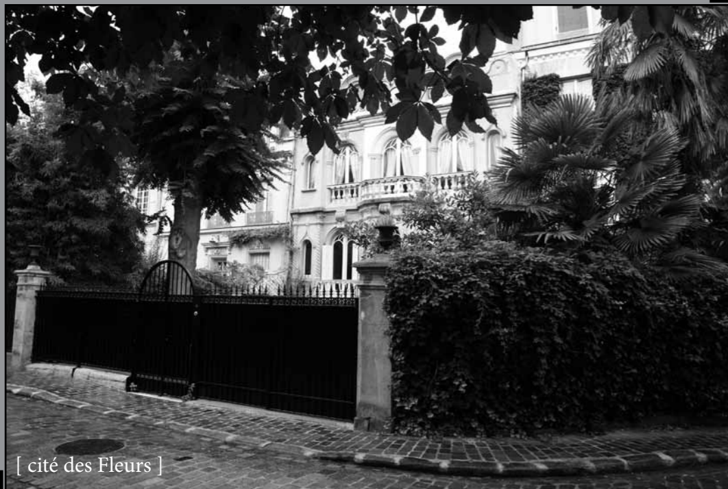
[ cité des Fleurs ]

Derrière l'avenue de Clichy déjà très habitée, des propriétaires de terrains, en 1847 décidèrent de les lotir. Ce sera la Cité des Fleurs. Le règlement stipulait que tous les jardins devaient être plantés d'arbres à fleurs. Aventure collective, sans doute, mais aussi aventures individuelles où les propriétaires de ces maisons bourgeoises ont permis aux architectes et aux décorateurs de laisser libre cours à leur imagination influencée par le goût romantique pour le passé en général et le moyen âge en particulier