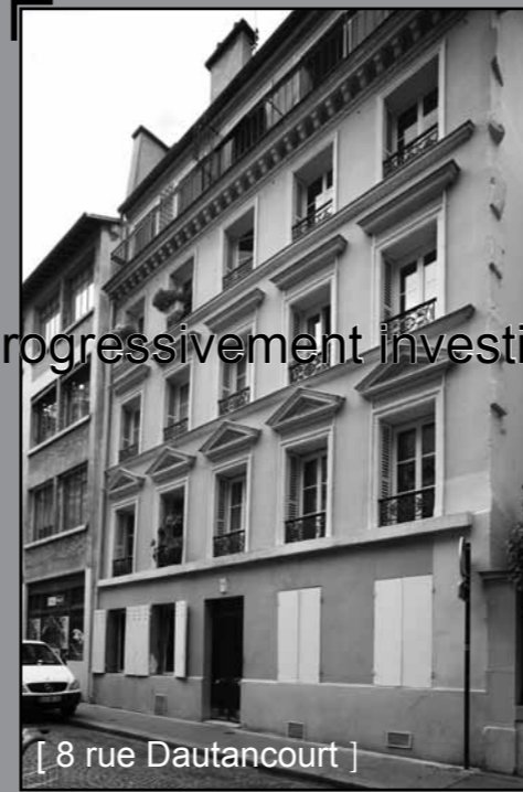
[ 8 rue Dautancourt ]

Fin du 19 ème siècle, la spéculation haussmannienne a fait son œuvre au centre de Paris. Le quartier des Epinettes a été rattaché à Paris en 1860. Il y reste encore des terrains constructibles.