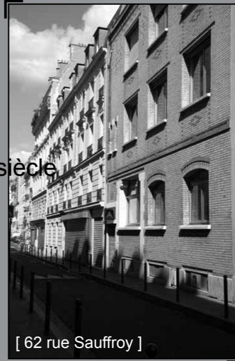
[ 62 rue Sauffroy ]