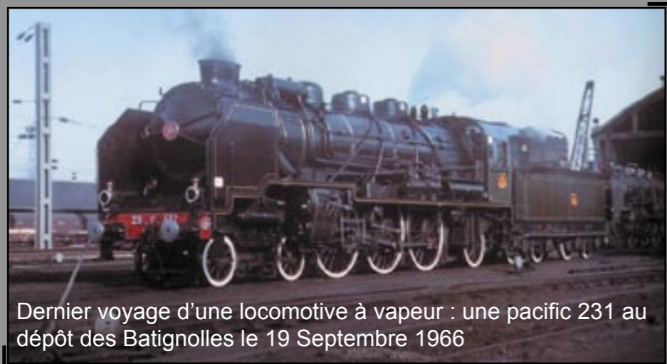
Dernier voyage d'une locomotive à vapeur : une pacific 231 au dépôt des Batignolles le 19 Septembre 1966