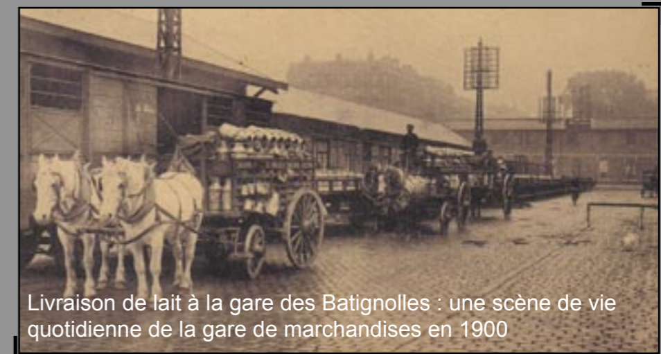
Livraison de lait à la gare des Batignolles : une scène de vie quotidienne de la gare de marchandises en 1900